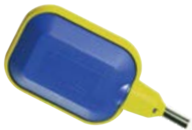
Regolatore di livello ad azionamento elettromeccanico Electromechanical float switches