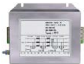
Filtri per compatibilità elettromagnetica in ambienti difficili EMC filters in harsh environments