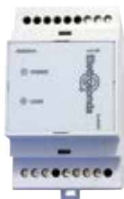
Sonde di livello montaggio a barra DIN Level Probes - DIN rail mounting