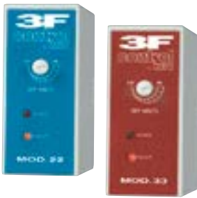
Controllori di rete Voltage controls