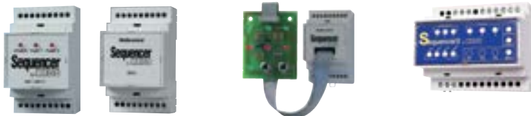
Moduli per inversione pompe Pump exchanger relay