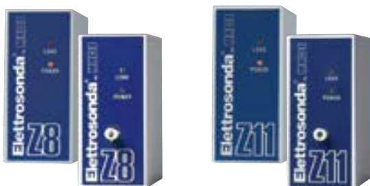
Sonde di livello - Montaggio su zoccolo Level Probes - Mounting on socket base