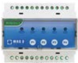
Connettore fra Hydrocontroller e centralina di irrigazione Connector between Hydrocontroller and control irrigation unit