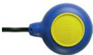
Regolatore di livello ad azionamento elettromeccanico Electromechanical float switches